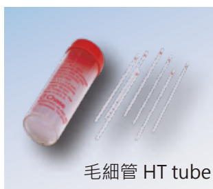
毛細管 HT tube

讀版、毛細管另購。 Reader and HT tubes not included.